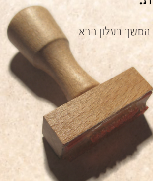
המשך בעלון הבא

תביעה ט': ניתוח - בעולם האמת מנתחים ומנקים כל איבר ואיבר שנהנה מהמאכלות אסורות.