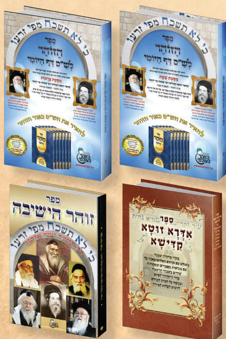
המשך בעלון הבא

הרבנית הצדיקת ע"ה, לא רצתה להעיר אותו בגלל שלא ישן כמה ימים, חשבה שיותר טוב שינוח קצת [כך היתה השגחה פרטית]. פתאום הוא התעורר לבד, וכבר הגיע הזמן של תפילת מנחה, וצועק אוי! לא אמרתי דרשה היום! מה יהיה עם כל היהודים?