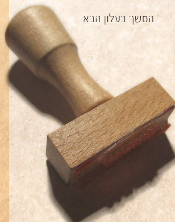
המשך בעלון הבא

אני תובע את הרב הזה בשש מיליון ש"ח, שהרג לי את הילדים שלי, וגדול המחטיאו יותר מההורגו, וכתוב בפרדס יוסף (שמות י, יד אות [קכד]) מחה אמחה (י"ג, י"ד). עיין ספר עשרה למאה [דרוש ט דף מ"ג ע"א] דעיקר כעס על עמלק לפי המדרש [במדב"ר כ"א, ד] גדול המחטיאו יותר מהרגו שהרגו הנפש, וכל האומות לחמו רק על הגוף ועמלק בא להחטיאם שיכפרו בהשגחה ואמר שהכל מקרה, וזה שנאמר [כי תצא כ"ה, י"ח] אשר קרך עיין שם, ולכן החמירה התורה כל כך שצריך למחות [למחוק] את זכר עמלק, כי הוא ראש ועיקר לכפירה בהקב"ה, על כן הגורם לה אכיל את ישראל נבילות וטריפות מעשהו כמעשה עמלק, [והוא מהעמלקיסטים] שמחטיא ורוצח נפשות ומייצר כופרים בסיטונאות.