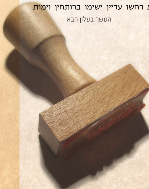
המשך בעלון הבא

ומעלתו רוצה לעמוד על הנסיון והוא כנמנע, ומפני כך נפל בטעות וכו' ולפי דבריו נצעק על הפוסקים שאבדו ממונן של ישראל לאסור פירות שיש בו מילבין הלא יש היתק ברותחין וכו' ולא התירו רותחין אלא שמא יש בקטניות תולעת שלא רחשו עדיין ישימו ברותחין וימות