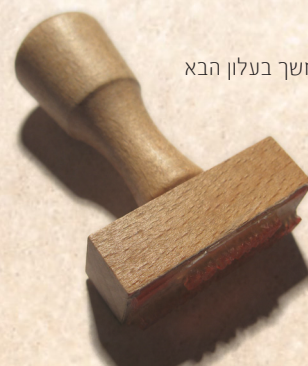
המשך בעלון הבא

[בלשון הקודש] ועל זה כתוב ונטמתם בם, בלי א', שלא נמצאת רפואה לתועבתו, ולא יוצא מטמאתו לעולמים. אוי להם! אוי לנפשם, שלא ידבקו בצרור החיים לעולמים, שהרי נטמאו! אוי לעצמם! עליהם כתוב (ישעיה טו) כי תולעתם לא תמות וגו', והיו דראון לכל בשר. מה זה דראון? סרחון. מי גרם לו? אותו הצד שנדבק בו.