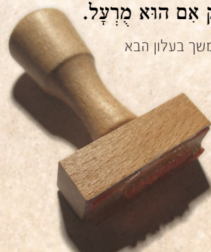
המשך בעלון הבא

אותו דבר הוא גם אצל מאכלות אסורות, שם הרי זה סם של הנפש, אז איך יתכן שיוכלו לאחז זאת בקלות, ולהכניס זאת לפה, אפילו כשמדבר רק בספק אסור, בדיוק כפי שהוא לא היה מכניס לפיו אכל שהיה ספק אם הוא מרעל.