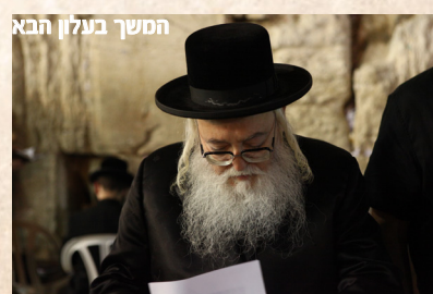
המשך בעלון תבא

שקדתי יומם ולילה בלי הרף על דלתות פתחיו, וזעיר שם וזעיר שם רשמתי איזו הערה בשוליו ועלה בידי לתקן שגיאות שונות אשר בטעות יסודן ספריו וחיבוריו: