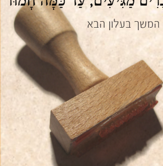
המשך בעלון הבא

לב ואחרון אחרון חביב נעתיק כאן דברים נעימים וקדושים המאירים כספירים מרבינו הקדוש שליט"א, הכותב בספר הקדוש דברי יואל ויקרא עמוד רנ"ה (ד"ה ופוק), וזה לשונו הקדוש: בא וראה עד להיכן הדברים מגיעים, עד כמה חמור