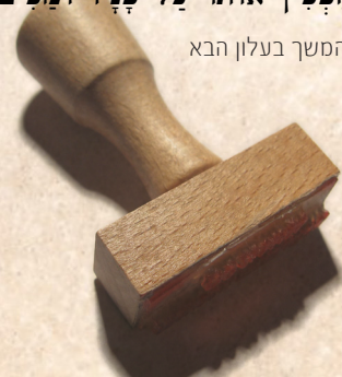
המסך בעלון הבא

כְּתִב בְּסִפְרֵי אֹר צְדִיקִים (פְּרָק י"ט), וְזֶה לְשׁוֹן קְדָשׁוֹ: דַּע פִּי מִי שֶׁלֹּא הָיָה מְדַקְדָּק בְּמֵאַכְלִים בְּעוֹלָם הַזֶּה וְלֹא הָיָה נֹזֶהר לְהִבְחִין בֵּין אֶסוּר לְהֵתֵר, וְאַפְלוּ אִינוּ אֶסוּר מִפְּרֵשׁ בְּתוֹרָה אֶלָּא מִחֲמִינּוּ ז"ל. עֲנֵשׁוּ שֶׁלֹּא אַחֵר מוֹתוֹ בֹּא הִמְמַנָּה עַל חַבּוּט הַקֶּבֶר וּמִפֶּה עַל בְּטֵנוּ בְּשֶׁרְבִיטוֹ שֶׁל בְּרוֹזל וְאַשׁ, עַד שֶׁפָּרְסוּ נִבְקַעַת וְיִוצָא פְּרִשְׁנָדָא, וְאַז מֵהַפְּכִין אוֹתוֹ עַל פְּנֵיו וּמִכַּיִם