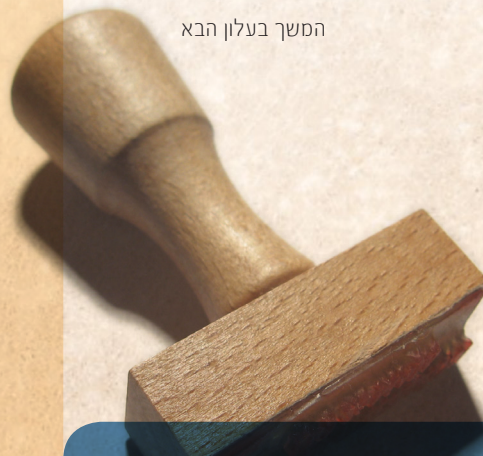
המשך בעלון הבא