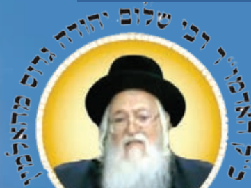
נשיא ארגון "מפעל הזוהר העולמי"

ויהי נעם אדני אלהינו עלינו ומעשה ידינו כוננה עלינו ומעשה ידינו כוננהו. [ב' פעמים], (סוד ה')