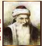
רבי יוסף קארו הרמ"ח - ה'של"ה השולחן ערוך, הבית יוסף, מרן והמחבר. עסק גם בקבלה