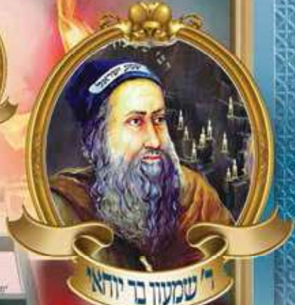
ר' שמעון בן יוחאי

החידושים "ספרי" לבני ישראל היו מלאי חוכמה ונבואה אשר לא ידעו כל ימיהם לעמוד על רגליהם