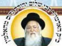
הרה"ק אב"ד ישיבת חסידי חסידי

מפעל הזוהר העולמי סניף בת ים רח"ב יהודה 50, בת ים