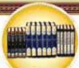
מחבר: הרב יוסף יוסף זיע"א