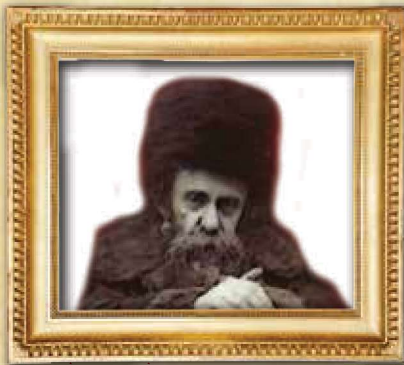
מודה כנגד מודה לא בטלה (מוד"ר בראשית ט' יא)

ועל כן להנצל מהם צריכים להיות מאד זהירים שלא לאכול חלב ודם. ולכן עדיף מאד לא לאכול כלל בשר בהמה. (פלא יועץ ערך בשר, טרף, שוחט). והגאון הריב"ז אמר שלא יהיה בהמה כשרה עד ביאת המשיח. ואי אפשר לאכול בשר בהמה כשר עד ביאת משיח צדקנו. (כ"ק האדמו"ר מקאשוי זצ"ל).