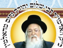
נשיא ארגון "מפעל הזוהר העולמי"