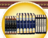
מחברים: סל למעלה מאתף ספרים