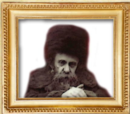
מדה כנגד מדה לא בטלה (מד"ר בראשית ט' יא)

ועל כן להנצל מהם צריכים להיות מאד זהירים שלא לאכול חֵלֶב וְדָם. ולכן עדיף מאד לא לאכול כלל בשר בהמה. (פלא יועץ ערך בשר, טרף, שוחט). והגאון הרי"ב ז"ל אמר שלא יהיה בהמה כשרה עד ביאת המשיח. ואי אפשר לאכול בשר בהמה כשר עד ביאת משיח צדקנו. (כ"כ האדמו"ר מקאשוי זצ"ל).