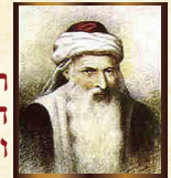
רבי יוסף קארו הרמ"ח - ה'של"ה השולחן ערוך, הבית יוסף, מרן והמהבר. עסק גם בקבלה

לעניין מיעוץ ומשמוש בסירכות הריאה, מוחלפת השיטה, מרן המחבר מחמיר, והרמ"א מקיל