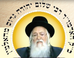
נְשִׂיא אֲרוֹן "מַפְעַל הַזֶּהר הָעוֹלָמִי"

וַיְהִי נַעַם אֲדָנֵי אֱלֹהֵינוּ עֲלֵינוּ וּמַעֲשֵׂה יְדֵינוּ בּוֹנֵנָה עֲלֵינוּ וּמַעֲשֵׂה יְדֵינוּ בּוֹנֵנָה. [ב' פעמים], (סיד ה')