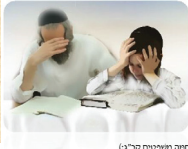
(הארץ השבתית 2013)