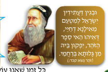
ובגין דעתידין ישראל למטעם מאילנה דחיי, דאיהו האי ספר האהר, ויקון ביה מן גלתיא ברחמי. (ת"ר ט"א ס"ד)

כל זמן שאנו עוסקים בדברי האדרא, "אתעטר" בא רבי שמעון מְעֵטֵר קמלך בעֵטְרוֹתֵי בְּרַאשׁ, ויושב בגוון (הארץ השבתית 2013)