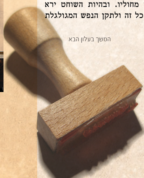
המשך בעלון הבא

כלל העולה: צריך השוחט להיות תם וישר ירא אלוקים וסר מרע ורחמן מאד. וכששוחט איזה בהמה חיה ועוף יאמר בתחלת השחיטה התפלה של מעלה. וכיון שעל הרוב מתגלגלים בהן נפשות לכן בעת ששוחט ידאג ויצטער על הצער שמרגיש הנפש המגולגלת אם יש שם. ויראה בעצמו כאלו מה שעושה לשוחט הבהמה הוא לתועלתה להושיעה מצערה שיושבת בגוף בהמה, ואף על פי שמצערה עם השחיטה כוונתו לטוב לה, כרופא הזה שמצער לחולה בהקזות והרקות וכוונתו לרפאו מחוליו. ובהיות השוחט ירא אלוקים לבו יטהר, לכן כל זה ולתקן הנפש המגולגלת שם.