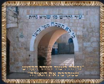
"גדולה לימוד הוזהר תקדוש שמקרבת את הגאולה"