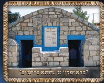
"בדא יפקון מן גלותא ברהמנים"