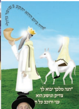
י"נה מלך יבוא לך צדיק ונושע הוא עני ורובב על ח