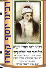
רבינו יוסף קארו זצ"ל בית המדרש הגדול בפראג בשנת ה'תקל"ח בבית המדרש הגדול בפראג (בית המדרש הגדול)

מכון "הלכות פסח לשלשים יום" – ללימוד כל אורח "הלכות פסח" שלשים יום קודם התג שיעל ידי "מפעל עולמו ללימוד שולחן ערוך מוצר עם רמ"א" הזהיר ממשהו חמץ בפסח – מובטח לו שלא יהמא כל השנה (הארז"ל)