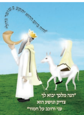
"הנה מלך יבוא לך צדיק ונושע הוא עני ורוכב על המור"