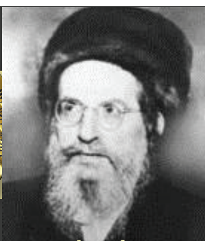
רבינו בעל הסולם נשמת האריז"ל בדורינו