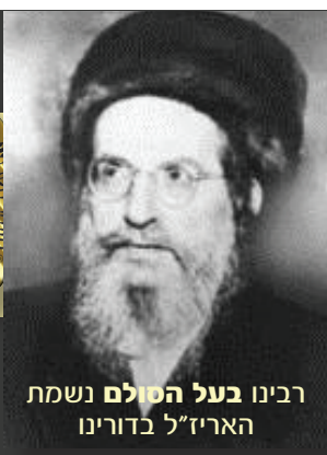
רבינו בעל הסולם נשמת האריז"ל בדורינו