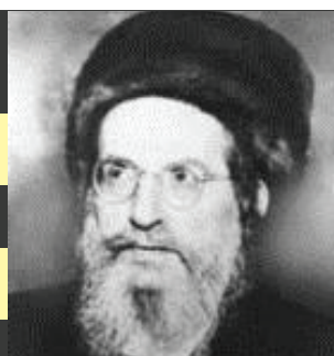
רבינו בעל הסולם נשמת האריז"ל בדורינו