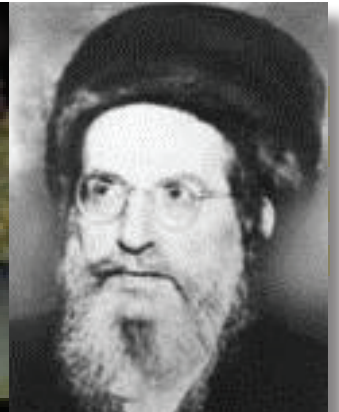
רבינו בעל הסולם נשמת האריז"ל בדורינו