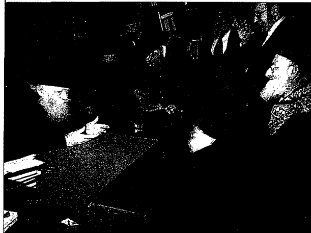
ברכה שלא נכשל בדבר הלכה (הערה 9)

חכמת-הנסתר אי אפשר שידע דין לאמתו! ובדור שלאחריו הדפיס תלמידו המובהק ר' חיים מוולוז'ין – את ספרו “נפש החיים” שרובו לקוח מספרי קבלה [...]. ובנוגע לספרדים [...].