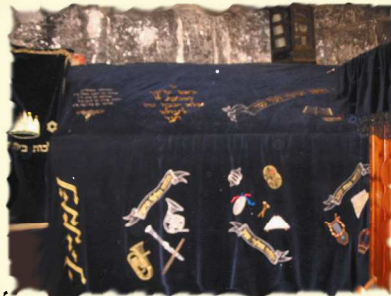
ציור דוד המלך

הזוהר ששבעים שנה אלו מאברהם יעקב ויוסף, לדוד המלך חמש שנים מאה ושמונים שנה חי וחמש שנה, יעקב נתן ושמונה שנים ולכן במקום שבעים וחמש שנה אברהם אבינו חי מאה