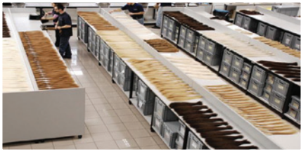
פירוט תהליך האוסמוזה ע"י לקמן עמ' מ"א

(הנקראת אוסמוזה) אשר מסירה את הפגמונטים של השיער בלבד [היינו הצבע] בעדינות. הגוון המדוייק של השיער תלוי באורך זמן השהייה בבריכות האוסמוזה, לדוגמא שיער ששהה 15 ימים יהא בהיר יותר מאותו שיער ששהה רק 10 ימים וכן הלאה. כך שלאחר זמן מסוים השיער הכהה נהפך לכל צבע מצבעי השיער הנדרשים. [ולצורך מראה טבעי מערבים כמה גווני בלונד וכדו'.]