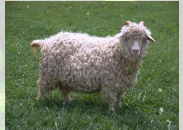
מִצְוֹת רֹאשִׁית הַגֵּז