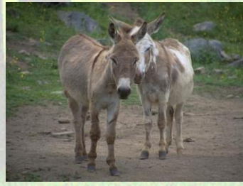
מִצְוֹת פְּדִיוֹן פֶּטֶר חֲמוֹר