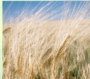
מִצְוֹת לְקַט פֶּאֶה שִׁכְחָה