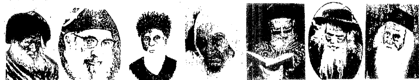
ר' יוסף חיים זינגער ר' יקותיאל יהודה האדומ"ר מאמ"ז ר' עובדיה יוסף יצ"ח אור"ח ר' ישראל סאט"ל ר' ישראל אהרן חיים חסידות ר' שמואל סלנט ר' חובבא חאק"י ר' יצחק אברהם צ"ח