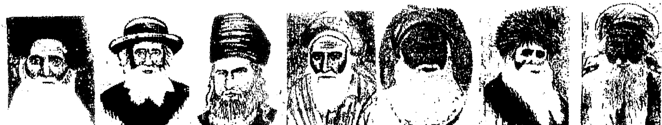
ר' חיים חקליהו פרישטיין ר' יוסף קאהן ר' יעקב קאהן ר' מנחם מענדל שניאורסון והרמב"ם - צ"ח ר' עבד יצחק חיות ר' אליהו דוד רביטוביץ תאומים - החדש