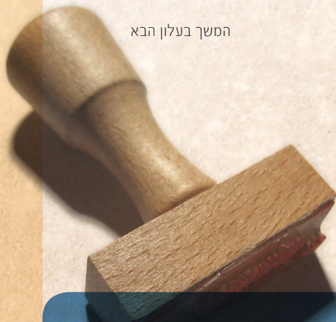
המשך בעלון הבא

א. בשוב מרן ה"חפץ חיים" מאחת הכנסיות הגדולות של אגודת ישראל שהיה אחד מקברניטי מועצת גדולי התורה שלה, עצרו הרב יהודה לייב פישמן מיימון מראשי ה"מזרחי" דאז. בלא היסוס, בחציפות, ובעזות פנים פנה אל מרן ה"חפץ חיים" ואמר לו: "אחרי שכבודו שמע שם לשון הרע, מחוייב הוא עכשיו לשרוף את ספרו "שמירת הלשון"... מה שמראה שבכל הקשור לשימוש רבני הציונות הדתית בתירוץ "לשון הרע" כנגד דעת התורה של גדולי ישראל, אין חדש תחת השמש וכאז כן היום...[אגב, שנים אחר כך פרסם הרב פישמן דברי נאצה נגד גדול הדור מרן הגרי"ז מבריסק תוך כדי שהוא מאשימו בתואר... "מבזה תלמידי חכמים"].