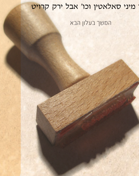
המשך בעלון הבא

וז"ל הערוך השלחן יו"ד פ"ד סעי' ס"ב עוד כתב (החכ"א כלל כ"ח) הירקות בכל המדינות מוחזקים בתולעים וכן ירק שקורין פעטרוסקא וקימ"ל ועשב שקורין הויפט או קאפ קרויט ושאר כל מיני ירקות מוחזקין בתולעים ואסור לאכלן בלי בדיקה, וכן מיני סאלאטין וכו' אבל ירק קרויט