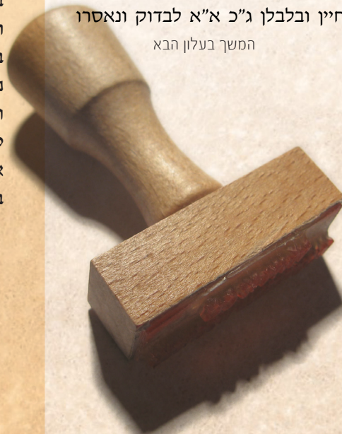
המשך בעלון הבא

ועוד בו שלישיה) השמיענו הרשב"א ז"ל דירקות דוקא כשהן חייין ושלמים יש להן בדיקה יפה אבל במבושלים ומבולבלין אי אפשר לבדוק ולפיכך הם אסורין שצריכין בדיקה ואין להם, ולפ"ז הירקות שחותכין אותן לחתיכות קטנות (שרעדאן בלע"ז) ורוחצים אותן לאחר החיתוך במים רבים, לא די שאסורין בלי בדיקה שהרי נתחזקו בחזקת מתולעים אלא אפילו אין להם בדיקה שוב כיון שמבולבלין ואין בדיקה מהני להם ואף שהרשב"א כתב במבושלים מ"מ אם עשה כן לירקות חייין ובלבדן ג"כ א"א לבדוק ונאסרו