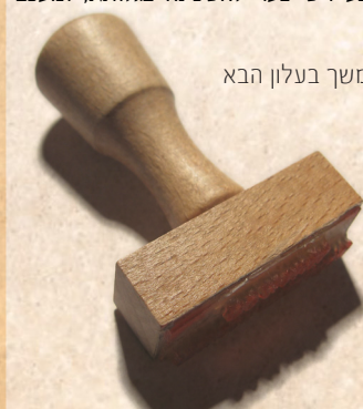
המשך בעלון הבא