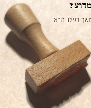
המשך בעלון הבא

ארור המן אשר ביקש לאבדי: וכן ארור המן גימטריה בשר, כי תלוי אם הבשר כשר אז הוא ברוך מרדכי, ואם הבשר טרף, אז הוא ארור המן, ומי הם הרבנים של עקבתא דמשיחא השייכים לערב רב, והם באמת, לא רק ארור המן, אלא הם ה"המן יסקים" האמיתיים [הבדציי"ם שנותנים הכשר על חנק העופות], וצריכים להתרחק מהם כמטחוי קשת, והסימן בזה הוא כך: שהצדיק הזה הוא יושב ולומד ומתפלל ואינו מוכיח את אנשי דורו ואינו רב את ריב ה', כמו שכתב הרמב"ם (הלכות סנהדרין פרק כ"ד הלכה ח', ועיין שכן ועונש פרשת נשא דף ק"ו, ועיין עוד שם) וכמו שכתוב בכתב סופר (שאלות ותשובות אבן העזר סימן מז) וז"ל: מי שיושב על כסא הרבנות לא יחוס על עצמו, רק על כבוד ה' יהיו עניניו ולבו תמיד. ולא רק שלא איכפת לו כלום אם הבשר כשר או אינו כשר, אלא גם יאמר "הבשר הזה הוא בודאי כשר, הלא יש להם ההכשר מרב הגדול הזה, או הבית דין הגדול הזה!", והכל בחזקת כשרות, על אף שידוע האמת שהרבה רבנים יצאו וצעקו שיש בעיות גדולות בהכשרות (וכל זה היה כתוב בספרים ובכל העיתונים ובקלטות) ושהרבנים אינם נאמנים כלל על פי ההלכה, ואם ישאל השואל מדוע?