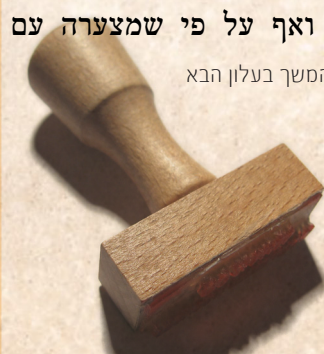
המשך בעלון הבא

כלל העולה: צריך השוחט להיות תם וישר ירא אלוקים וסר מרע ורחמן מאד. וכששוחט איזה בהמה חיה ועוף, יאמר בתחלת השחיטה התפלה של מעלה. וכיון שעל הרוב מתגלגלים בהן נפשות לכן בעת ששוחט ידאג ויצטער על הצער שמרגיש הנפש המגולגלת אם יש שם. ויראה בעצמו כאלו מה שעושה לשחוט הבהמה הוא לתועלתה להושיעה מצערה שיושבת בגוף בהמה, ואף על פי שמצערה עם