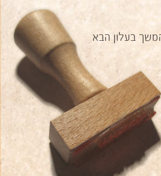
המשך בעלון הבא