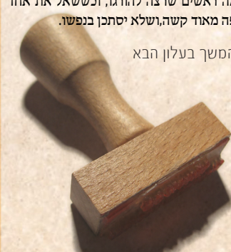
המשך בעלון הבא