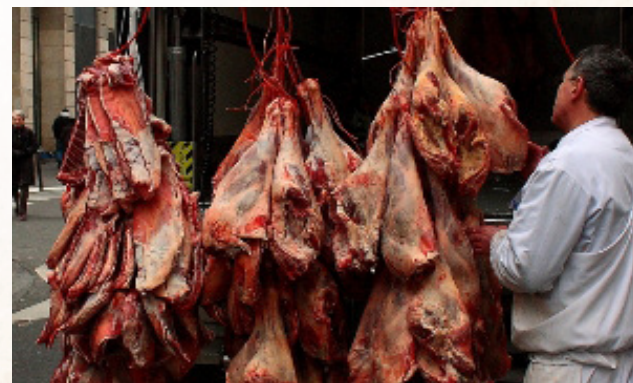
המשך בעלון הבא

הרבנות קריית ביאליק השעתה את תעודת הכשרות משני העסקים. מי שרכש בשר במקום מתבקש לעשות שאלת רב כיצד להכשיר את כליו.