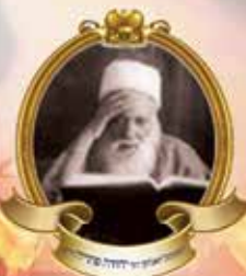
רבני צפת קבל הסכמה מוויז'ניץ י"ב לסיועו י"ן תרע"ח על האלימות