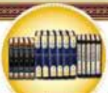
מכתבים על מלחמת העולם השנייה