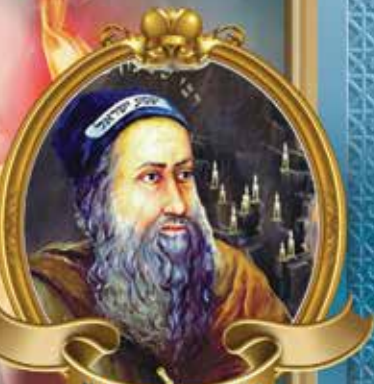
ר' שמעון בר יוחאי