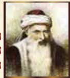
רבי יוסף קארו הרמ"ח - ה'של"ה השולחן ערוך, הבית יוסף, מרן והמחבר. עסק גם בקבלה