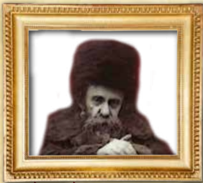
מודה כנגד מודה לא בטלה (מר"ר בראשית ט' יא)