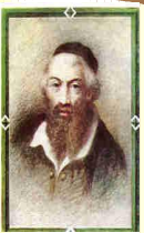
רבינו משה אלשיך זיע"א בעל מחבר ספר "רמ"א" בשנת ה'ר"ל (1568) נולד בירושלים (שם אביו ר' ישראל ז"ל)

מכון "הלכות פורים לשלשים יום" – ללימוד כל אר"ח "הלכות פורים" שלשים יום קודם פורים שיעל ידי "מפעל עולמי ללימוד שולחן ערוך מחבר עם רמ"א" פורים אתקריאת על שם יום הכפורים (מקורו זו) - כל המועדים יהיו בטל"ן, וימי הפורים לא יהיו נבטל"ן לעולם (מדוע משל"ט)