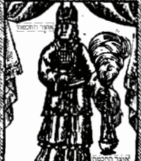
בגדי קדש לאהרן אהרן