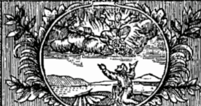
ועל אידו כסערה השמי' ולקחרור את הכנור ונגן