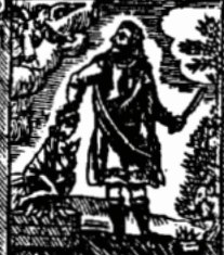
אלתשלח ידך להצער

בית הבודד ספר כן הי"ס והכבו חגבר רועל אברה מי"ס קסיניא ו'ל' : בשנת תר"ק בא' ב'תני' י' חיה ל'ק' :