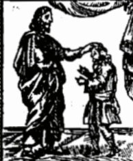
ויתוך האלהים מסל