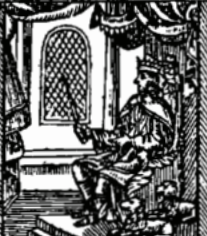
ויישר נשלמה על כמאה