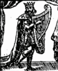
משהושי לוחת הערת