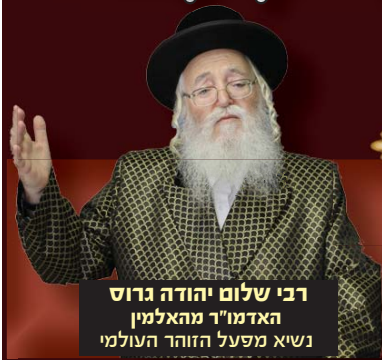
רבי שלום יהודה גרוס האדמו"ר מהאלמין נשיא מפעל הזוהר העולמי