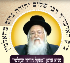
נְשִׂיא אֲרוֹן "מַפְעַל הַזוֹהַר הָעוֹלָמִי"

וַיְהִי נַעַם אֲדֹנָי אֱלֹהֵינוּ עֲלֵינוּ וּמַעֲשֵׂה יְדֵינוּ כּוֹנְנָה עֲלֵינוּ וּמַעֲשֵׂה יְדֵינוּ כּוֹנְנָהוּ. [ב' פעמים], (סיד ה')