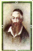
רבינו משה אלשיך זיע"א בעל מחבר ספר "רמ"א" פס"ה בענין קריאת י"ד י"ד יום שנת הוא שנתה לפ"ה יום מנוחתו פס"ה (שם אביו ר' ישראל ז"ל)