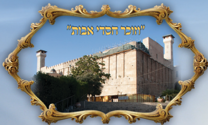
"יוזכר חסדי אבות"