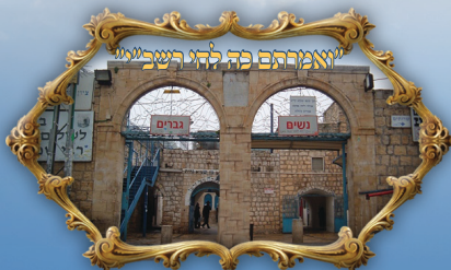
"ואמרתם פה להי רשבי"