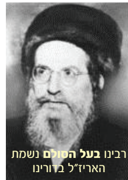
רבינו בעל הסולם נשמת האריז"ל בדורינו

יו"ל ע"י "ארגון צעירי ויזניץ" בנשיאות כ"ק מרן אדמו"ר שליט"א קרית ויזניץ בני ברק ☆ ת.ד. 1120 ☆ טל. 6764807