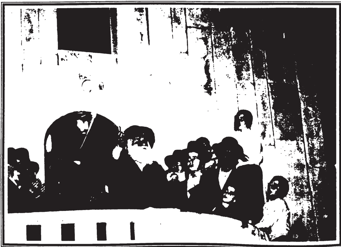
כ"ק אדמו"ר שליט"א בעת ההדלקה - ל"ג בעומר תשנ"ט

באחת השיחות הכריז אדמו"ר זצ"ל ואמר: "אבי הקדוש היה גר אצל ר' שמעון" -