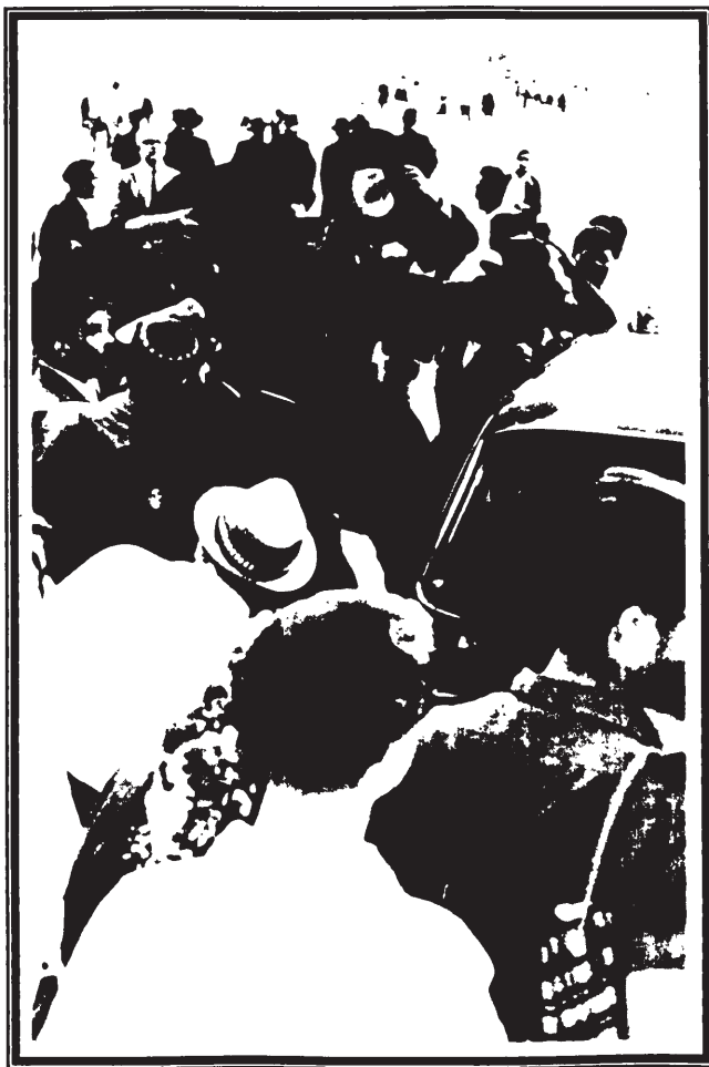
רבינו זי"ע כחזרתו מהכותל המערבי

רבינו ציוה לזמר ולרקוד, באמרו: "הכתוב אומר (שיר-השירים ד, ח) "תשורי מראש אמנה", ומובא במדרש (שמות-רבה כג, ו) עתידין ישראל לומר שירה לעתיד לבוא, ומפרש השל"ה הק', שכבר עתה