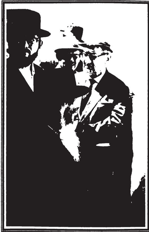
רבינו זי"ע בעת שפוך שיח ע"י הכותל המערבי

למחרת, ביום שני פרשת במדבר, החליט רבינו כי ביום המחרת, כ' באייר, יסע למירון, בהחבא. בני הבית נחרדו בשומעם זאת, וכאשר סירבה הרבנית להסכים לכך, מחשש סכנת פרוץ המלחמה בכל