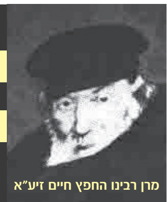
מנחם מנדל החפץ חיים זיע"א