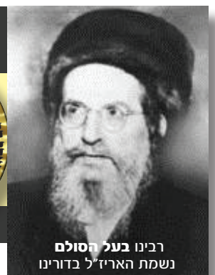
רבינו בעל הסולם נשמת האריז"ל בדורינו