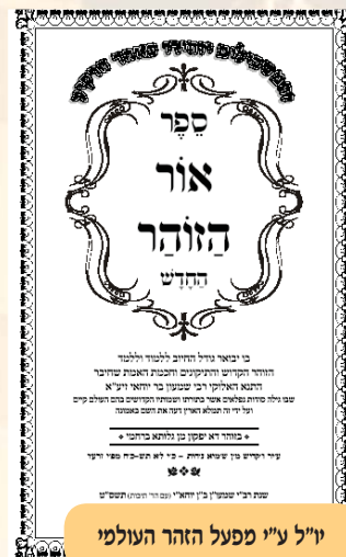
יו"ל ע"י מפעל הזהר העולמי