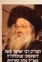
הצה"ק רבי ישראל משה דושינסקי זצוקלה"ה גאב"ד עדה החרדית

לכן מן הראוי שיהא הזוהר הקדוש הזה בכל בתי ישראל,