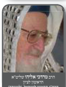
הרב מרדכי אליהו שליט"א ראשון לציון הרב הראשי לישראל (השני)