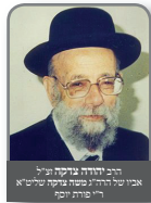
הרה"ק יהודה מנחם טייטלבוים אב"ד של הרה"ק שמואל אבן עזיר