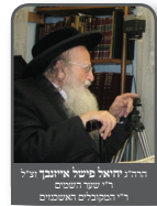
הרה"ק יהודא פתיה צוק"ל זיע"א הראשון לציון ר"ר המסמכים והאשכולים