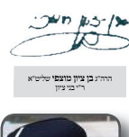
הרה"ק בן ציון מנחם טייטלבוים ר"ר בני ציון