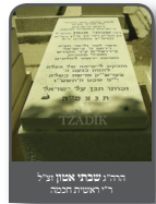
הרה"ק שמואל אבן עזיר ר"ר האשכולים והאשכולים