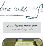
מנחם טייטלבוים שמואל טייטלבוים ר"ר המסמכים והאשכולים