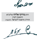
הרה"ק שמואל אבן עזיר ר"ר האשכולים והאשכולים