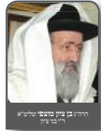
הרה"ק בן ציון מנחם טייטלבוים ר"ר בני ציון