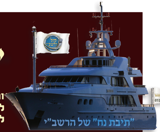
"תיבת נח" של הרשב"י

והוא קול קורא לכל יהודי ויהודי באשר הוא, להכנס לתוך התיבת נח של הזוהר הקדוש, להינצל מדור המבול הנורא השוטף את הארץ