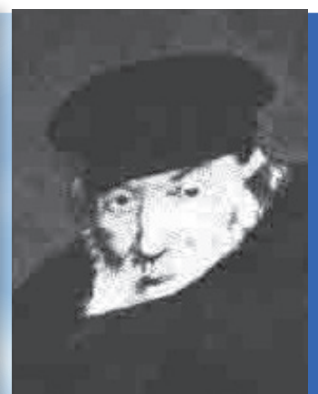
מֶרֶן רבינו החפץ חיים זיע"א