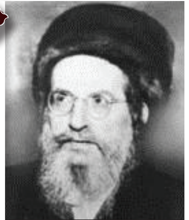
רבינו בעל הסולם נשמת האריז"ל בדורינו